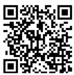
ケータイからどうぞ!