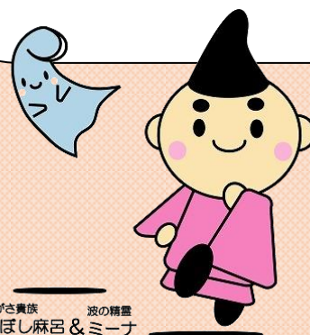
ちがさ貴族 波の精霊 えぼし麻呂&ミーナ