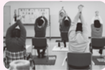
イベント開催によるボランティア参加のきっかけづくり(障害者対象ヨガ教室の様子)