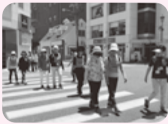
ボランティアの育成 (ボランティア大学の様子)

「みんながつながるちがさきの地域福祉プラン」の中間評価を計るために行った「地域福祉に関する市民意識調査(平成29年度に市と市社協とで実施)」の結果では、地域のボランティア活動に「参加している」と回答した方は13.8%、「参加していない」と回答した方は86.2%でした。しかし、「参加していない」と回答した方のうち、「今後参加したい」と回答した方が43.7%となっており、4割程度の方は活動に興味があり、ゆくゆくは参加の意向があるということが分かりました。