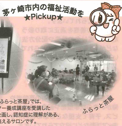
小和田地区の「ふらっと茶屋」では、認知症サポーター養成講座を受講した住民の方で企画し、認知症に理解がある、認知症の方も集えるサロンです。

10月1日より赤い羽根共同募金が始まります。今年も皆さまのご協力をお願いいたします。